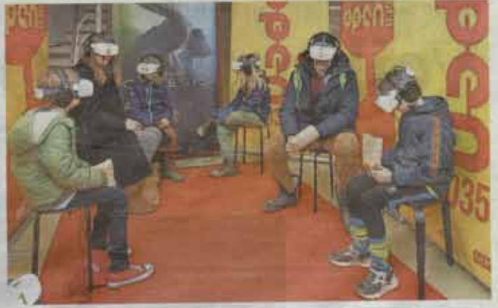
Met een VR-film word je naar het ontstaan van de sarde geleid.

REPORTAGE Hilversummers maken kennis met cultuur door OPEN035