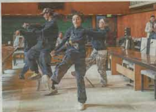
The creatives voeren een spectaculaire dans uit in de raadzaal.

Ook in de bibliotheek op de 's Gravelandseweg zijn kinderen aan het knutselen. Daar organiseert de stichting PubArt op de benedenverdieping een workshop. „PubArt verzorgt allerlei kunstprojecten, met kunstenaars uit allerlei verschillende disciplines, heel breed”, vertelt Eijganen Jelsma, die op de verdieping erboven een wat ouder