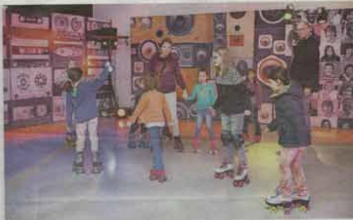
De skatebaan is er helaas maar één dag.