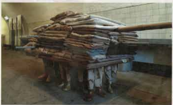
'Geeft Acht!' Kunstwerk door Elaine Vis

Toegangsprijs: Gratis met museumkaart Volwassenen: €9,- Kind 5 t/m 12 jaar: €5,- Kind t/m 4 jaar: gratis Rondleidingen: volwassenen €4,50, kinderen €3,-