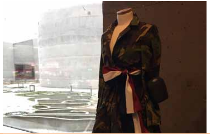
In het museumgebouw