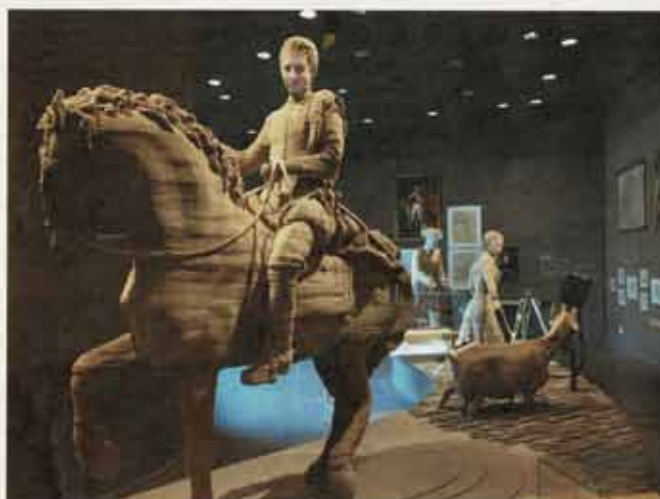
Prins Maurits vertelt over zijn plan voor de waterlinie

De nieuwe tentoonstelling 'Geeft Acht! Schone kunst van militaire kleding' in het Waterliniemuseum Fort bij Vechten geeft aandacht aan een groeiend probleem; textielafval. Velen denken bij textielafval alleen aan de mode-industrie, maar ook defensie, de politie en gezondheidszorg kampen met deze problematiek. Het gebruik en de verwerking van uniformen is aan strikte regels gebonden, want een uniform mag niet als zodanig terugkeren in de maatschappij. Hier moeten oplossingen voor gezocht worden. Dit is het uitgangspunt voor de nieuwe tentoonstelling die tot 31 maart 2019 te bezoeken is.