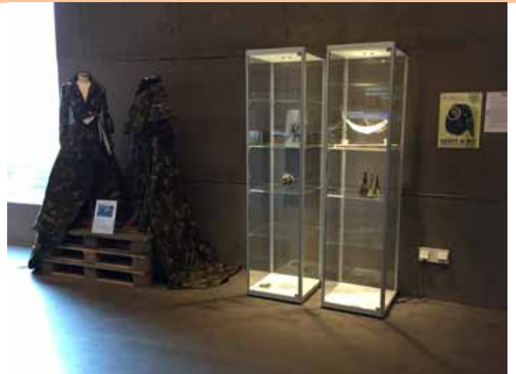
Ontwerpen van modeontwerper Mo Benchallal